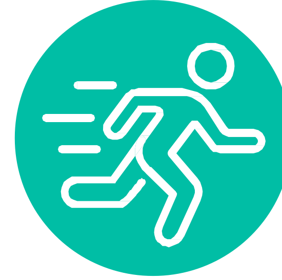
الإنسان كائن نشط

إمكانية وجود المزيد من القصص في الحياة (ليست قصة واحدة فقط)