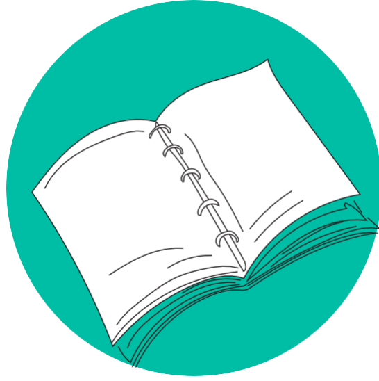
بناء قصة جديدة

تفكيك " قصص المشكلة " وبناء " قصص قوة ". أداة لمعالجة التجارب المسبّبة للصدمة من خلال قصة جديدة.