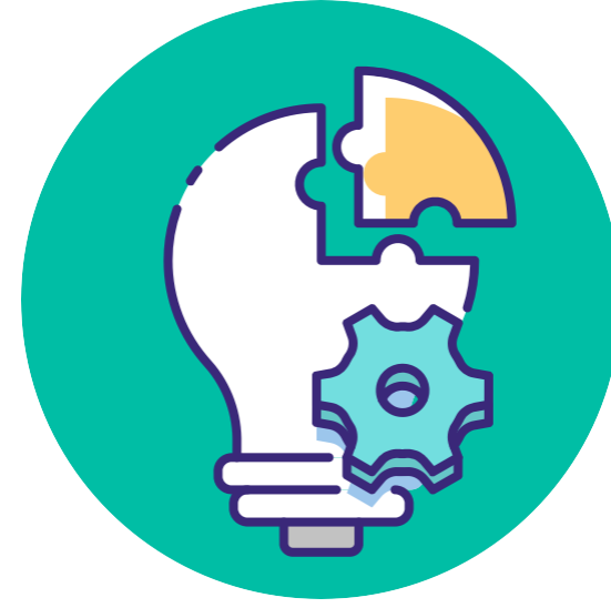
الإنسان ليس المشكلة

تفكيك " قصص المشكلة " وبناء " قصص قوة ". أداة لمعالجة التجارب المسبّبة للصدمة من خلال قصة جديدة.